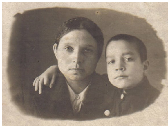
Я и мама

На улице Дорожной, за школьным интернатом, чуть в стороне от дороги, расположен небольшой домик. Он и со стороны-то небольшой, а как в него втискивались 3 квартиры, вообще не ясно. Сколько себя помню, я жил в одной из них. На 12 квадратных метрах - печь, стол, сундук, кровать, табуретки и мы: бабушка, мама и я.