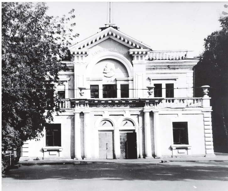
ДК спирткомбината в 1970-е годы