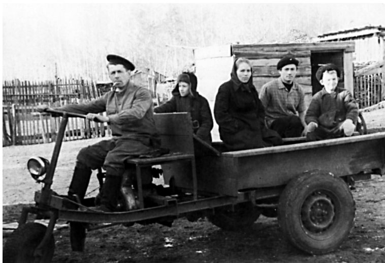
Любимое транспортное средство нашей семьи