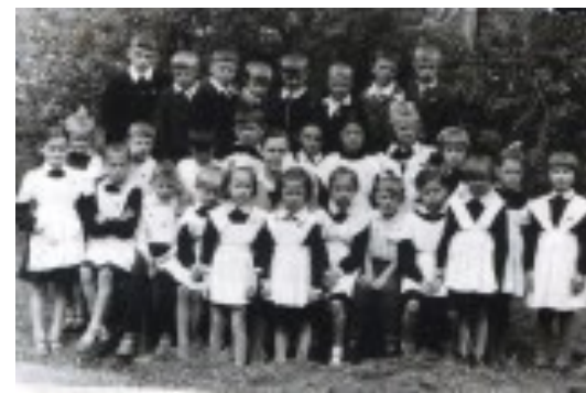
Началь- на ул.

С раннего детства на моём жизненном пути мне встречались хорошие, открытые и добрые люди, хотя со временем в памяти стираются имена и фамилии, но остаётся свет от искорки, которую они смогли зажечь в моей душе!