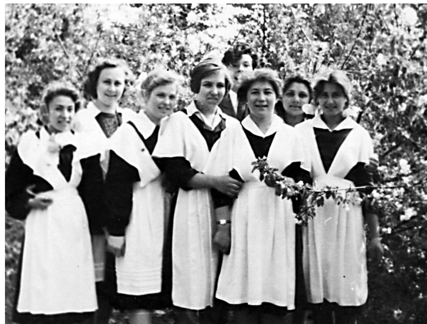
Это – мы, выпускники одиннадцатого класса школы № 7 г. Мариинска 1962 года.