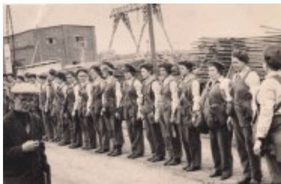
Мариинский ликероводочный завод, соревнование по гражданской обороне.