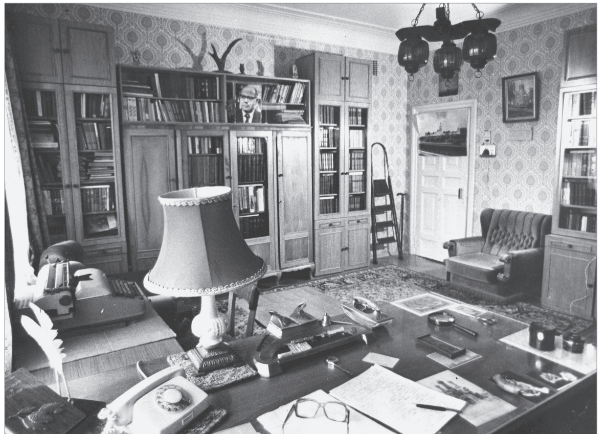
Рабочий кабинет В.А. Чивилихина

Но всегда трогательна каждая встреча с прошлым. Тем более что работа и прочная дружба с литературно-мемориальным музеем В.А. Чивилихина связывает меня уже четвертое десятилетие. В памяти середина восьмидесятых, когда зарождался музей, реставрировалась и обновлялись строения будущего Дома-музея, выстраивались образы будущих экспозиций, собирались материалы.