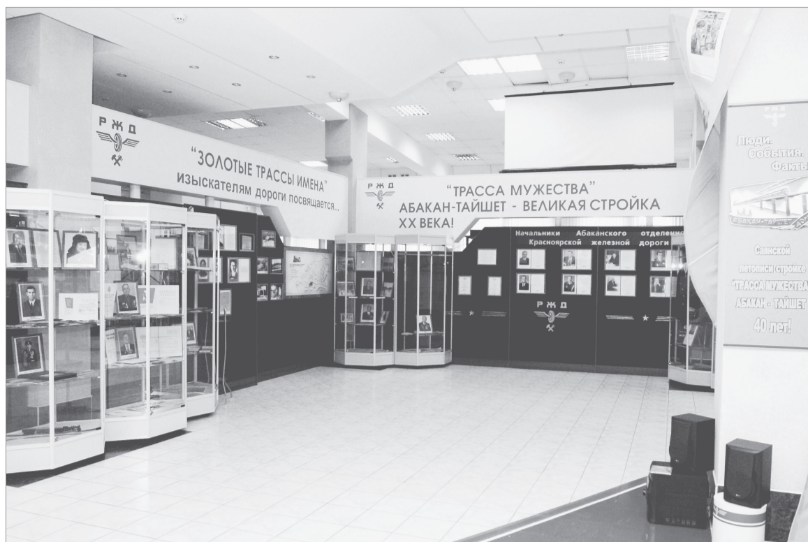
Экспозиция музея Абаканского отделения железнодорожного транспорта. 2007 год

МНЕ было интересно «покопаться» в декабристском направлении истории семьи Чивилихиных. Дело в том, что декабрист Николай Осипович Мозгалевский, когда-то умерший в Минусинске, - прадед супруги Владимира Чивилихина. И погрузившись в тему декабристов, я многое узнал и осмыслил в этой главе нашей отечественной истории. И к примеру, демонстрировавшийся на телевидении художественный фильм «Союз Спасения» смотрел с при-